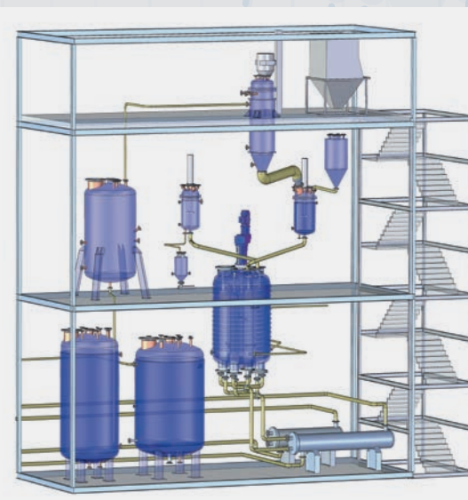
Б Черновая схема установки